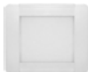
Mini Dalle LED 12V/3W DLSA126