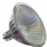
Lampe halogène 12V/10W ø51 mm ECL032