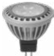
Lampe Led 12V/4W MR16/4W