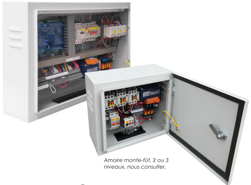
Armoire monte-fût, 2 ou 3 niveaux, nous consulter.

Notre service technique reste à votre disposition jusqu'au bon fonctionnement de l'installation