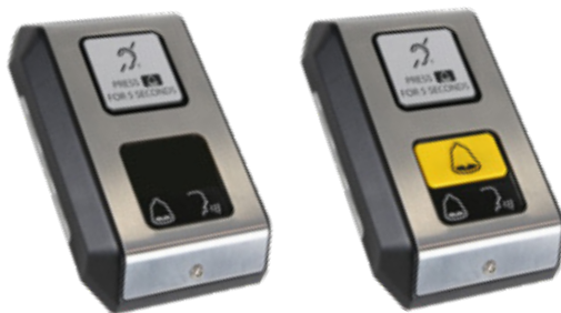
C100 SM2 (sans bouton d'alarme)