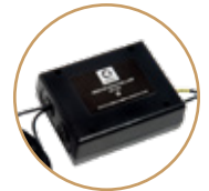
451000 (boucle inductive)