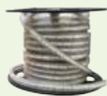
1 bande LED SHM107 Longueur 15 mètres

Exemple pour un éclairage de 15 mètres, le kit comprends :