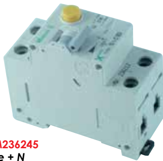
PKNM236245 1 pôle + N