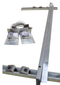
Kit 1 contact : FC379/1 Kit 2 contacts : FC379/2