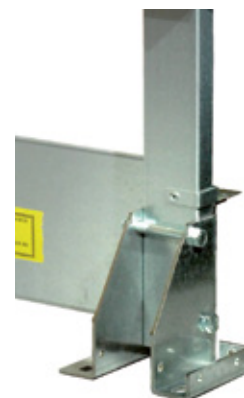
Pieds de fixation

(1) Compte tenu de la distance libre dans un plan horizontal au-delà du bord extérieur de la main courante de la balustrade, sa hauteur doit être au moins de :